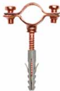
art. 6045-R COLLARI LEGGERI IN RAME COPPER LIGHT CONDUIT CLIP COLLARS