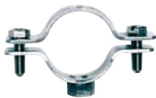
art. 6040-P COLLARI PESANTI IN ACCIAIO ZINCATO GALVANISED STEEL CONDUIT CLIP COLLARS

ELEMENTI DI FISSAGGIO FASTENINGS COMPONENTS