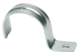
art. 6046 GAFFETTE CON ASOLA GALVANISED STEEL CONDUIT CLIP WITH SINGLE HOLE