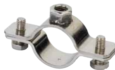
art. 6040 inox

* Resistenza minima dei dadi elettrosaldati. * Resistenza minima dei dadi elettrosaldati.